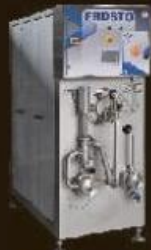
FROSTO 400-1600 automatic continuous freezers