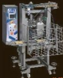
JUMBO SERVO filling and extruding stations