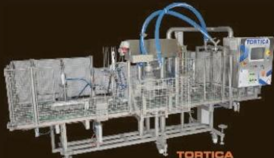
TORTICA ice cream cakes and bulks machine