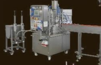
EXPERT CRF / SRF / RVF rotary cup, cone and bulk fillers