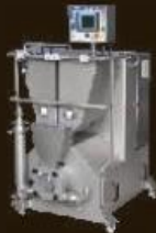
MASTER FF 1200-4000 fruit feeders