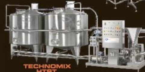
TECHNOMIX HTST pasteurisation plant