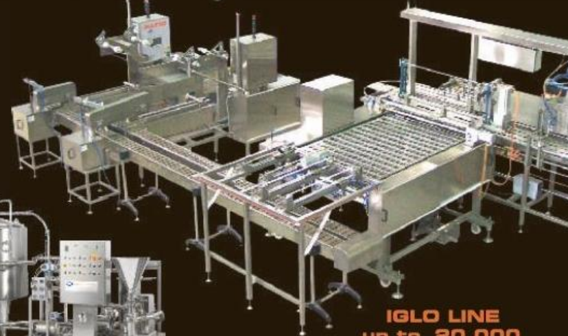
IGLO LINE up to 20 000 extruding and hardening tunnel

ice cream machines Macchine per gelato Máquinas para helados Обладнання для виробництва морозива 冰淇淋生产机械 Echipamente pentru Inghetata Stroje na výrobu zmrzliny maszyny do produkcji lodów machine pour crème glacée Պաղպաղակի Արտադրման Սարքավորում DONDURMA MAKINALARI Оборудование для производства мороженого Speiseemaschinen ماشین آلات بستنی