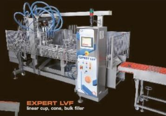
EXPERT LVF linear cup, cone, bulk filler