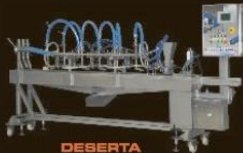
DESERTA log machine