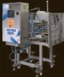
JUMBO ROBOT robotized bulk filler/decorator